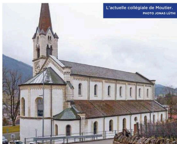
L'actuelle collégiale de Moutier.