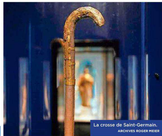
La crosse de Saint-Germain.